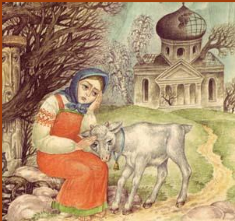
Нарушение запрета (№3)