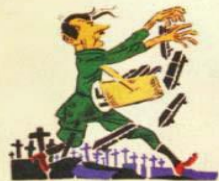
3. ХОЧЕТ ЗЕМЛЮ УСЕЯТЬ ГРОВАМИ