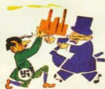
2. ХОЧЕТ ЗАВОДЫ БУРЖУАМ ОТДАТЬ