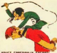
4. ХОЧЕТ СВОБОДНЫХ СДЕЛАТЬ РАБАМИ