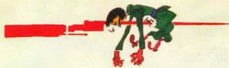
ПОЛУЧИТ -ПТРЕ ЗА КАЖДЫЙ УДАР ДЕСЯТКИ ПОЖАРОВ ЗА КАЖДЫЙ ПОЖИР