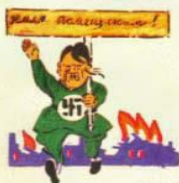
1. ХОЧЕТ -ХЛЕБ У КРЕСТЬЯН ОТНЯТЬ.